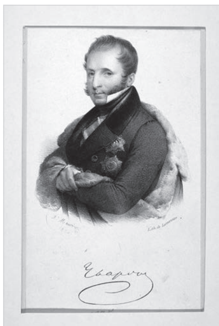
Ил. 6. А. Морин/Маурин (Antoine Maurin, 1793–1860). Портрет графа С.С. Уварова. 1830-е (после 1835 г.). Бумага, литография (издание Ж.-Р. Лемерсье, Париж). ВМП