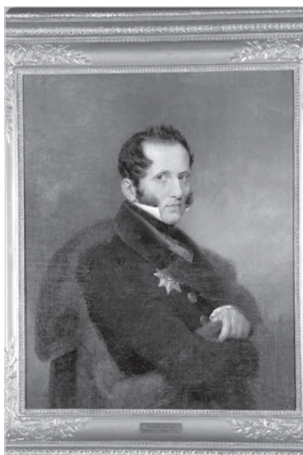
Ил. 5. В.-А. Голике (1802–1848). Портрет графа С.С. Уварова. 1833 г. холст, масло. МИХМ