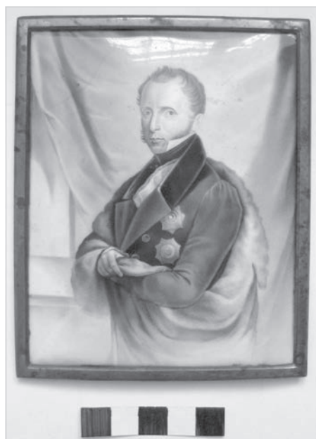
Ил. 1. А. Н. Сальников (1817–1880-?). Портрет графа С. С. Уварова по литографии А. Маурина 1830-х (после 1835 г.). Медь, живописная эмаль в техники гризайли. Середина – третья четверть XIX в.(?)