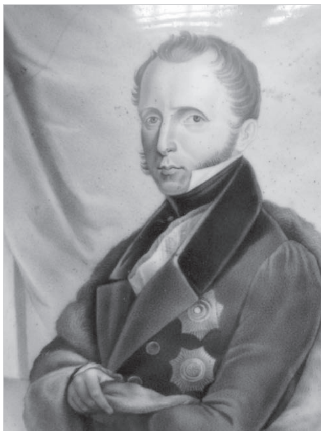
Ил. 4. А. Н. Сальников (1817–1880-?). Портрет графа С.С. Уварова по литографии А. Маурина 1830-х (после 1835 г.). Медь, живописная эмаль в технике гризайли. Середина – третья четверть XIX в.(?). Фрагмент