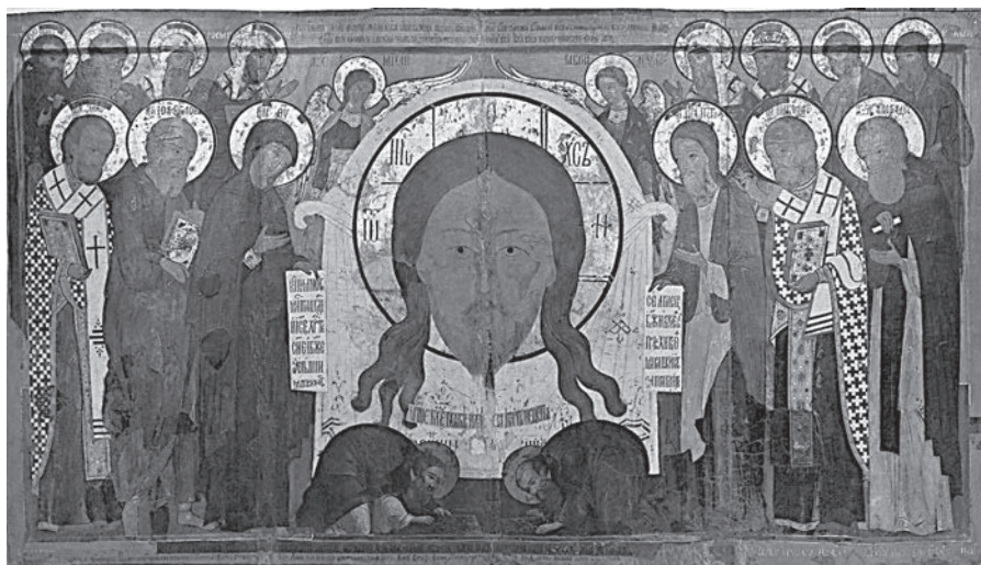
Ил. 1. Икона «Спас Нерукотворный с избранными и ростовскими святыми. Около 1665 г., 1675/76 г., XVIII в. ГМЗРК