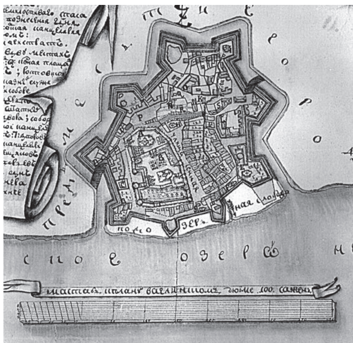
Ил. 4. План центральной части Ростова в черте земляной крепости. Между 1755 – 1760 гг. Российский государственный исторический архив