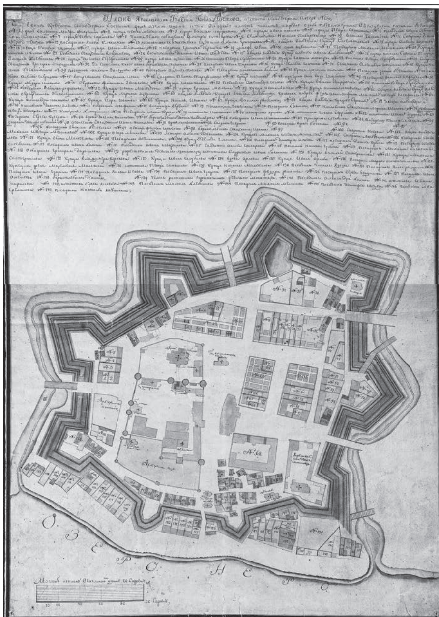
Ил. 6. План центральной части Ростова начала XIX в. ГМЗРК