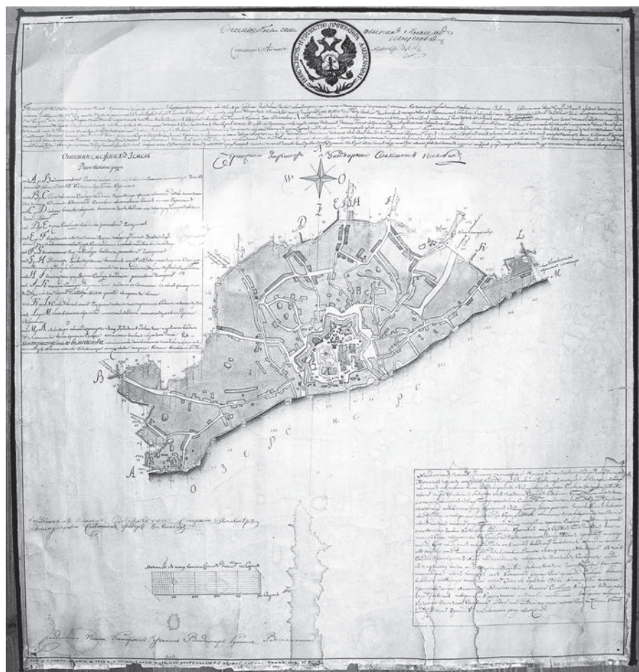
Ил. 5. План Ростова 1771 г. Копия. ГМЗРК